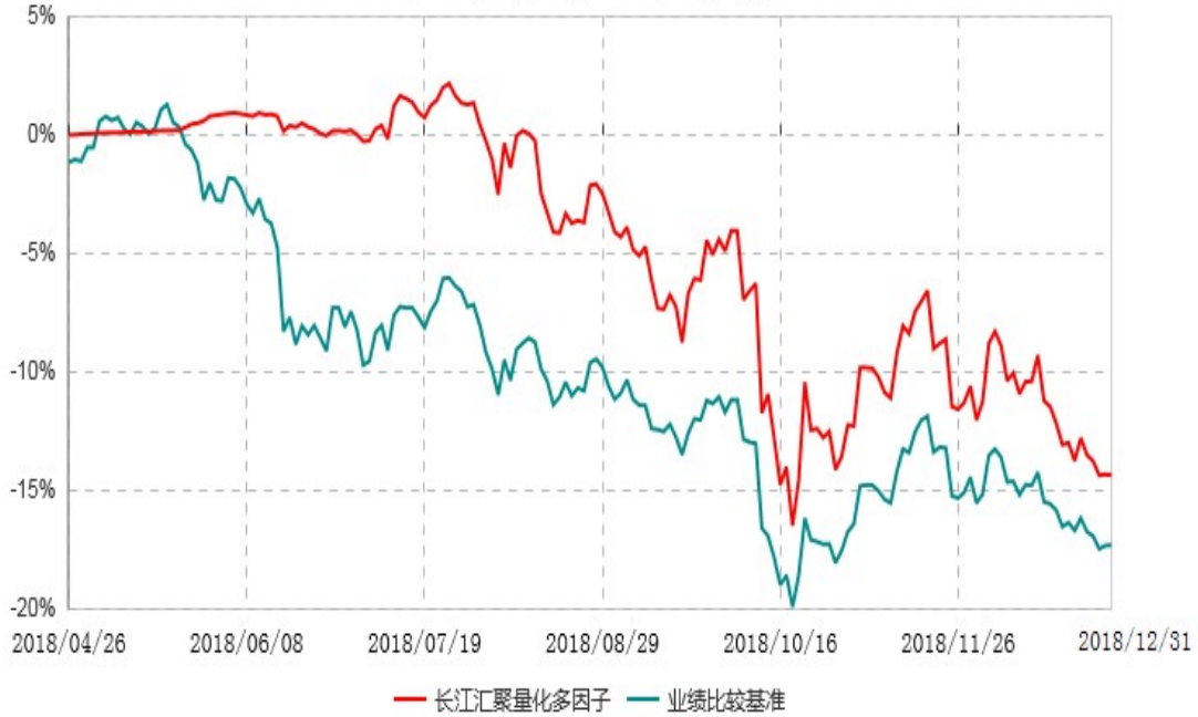
长江汇聚量化多因子灵活配置混合型发起式证券投资基金累计净值增长率与业绩比较基准收益率历史走势对比图 (2018年04月26日-2018年12月31日)

注：（1）本基金基金合同于2018年4月26日生效，截至本报告期末未满一年；（2）本基金建仓期为基金合同生效日起6个月内，建仓期结束时各项资产配置比例均符合基金合同约定。