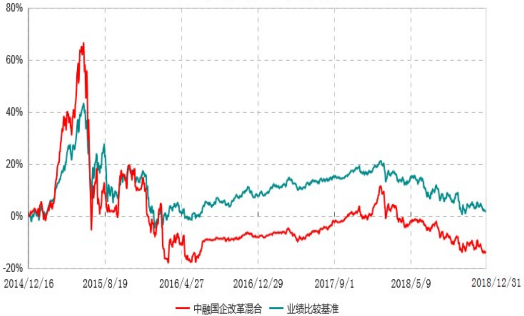
中融国企改革灵活配置混合型证券投资基金累计净值增长率与业绩比较基准收益率历史走势对比图 (2014年12月16日-2018年12月31日)

注：按照基金合同和招募说明书的约定，本基金自合同生效日起6个月内为建仓期，建仓期结束时本基金的各项资产配置比例符合基金合同的有关约定。