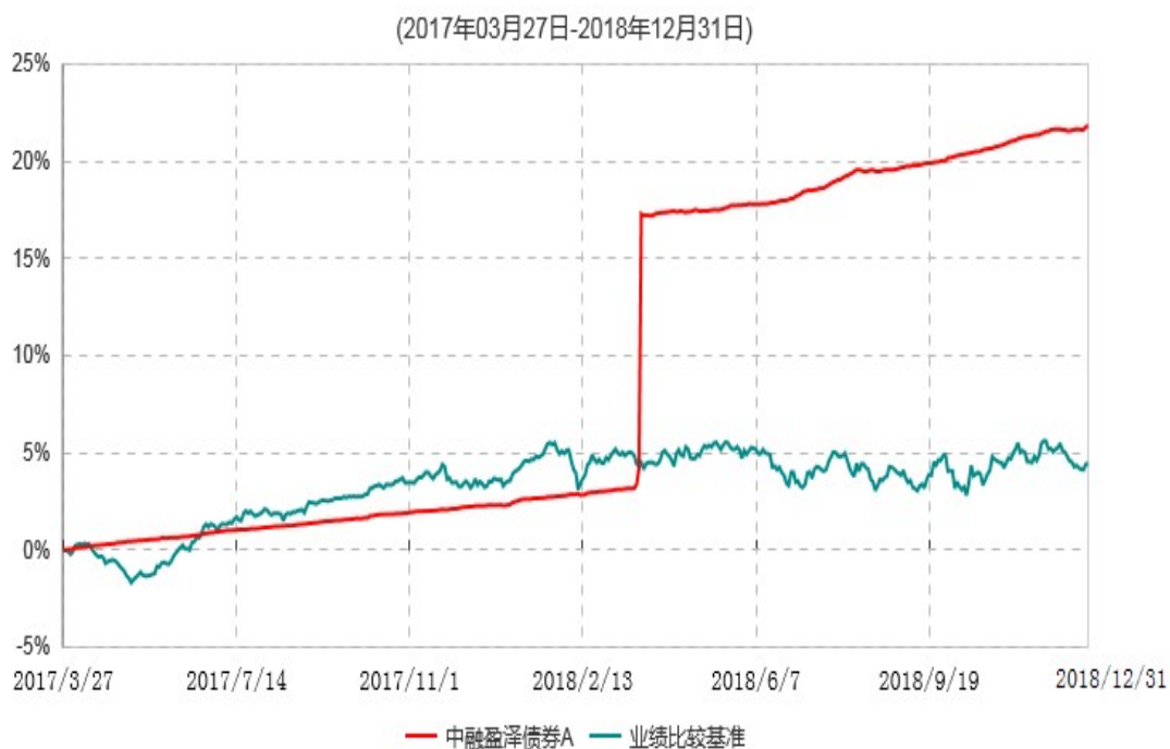
中融盈泽债券A累计净值增长率与业绩比较基准收益率历史走势对比图