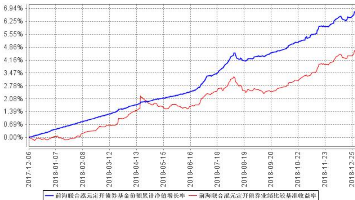
前海联合泓元定开债券基金份额累计净值增长率与同期业绩比较基准收益率的历史走势对比图

注：本基金的建仓期为 6 个月，建仓期结束时各项资产配置比例符合基金合同规定。截至报告期末，本基金建仓期结束未满 1 年。