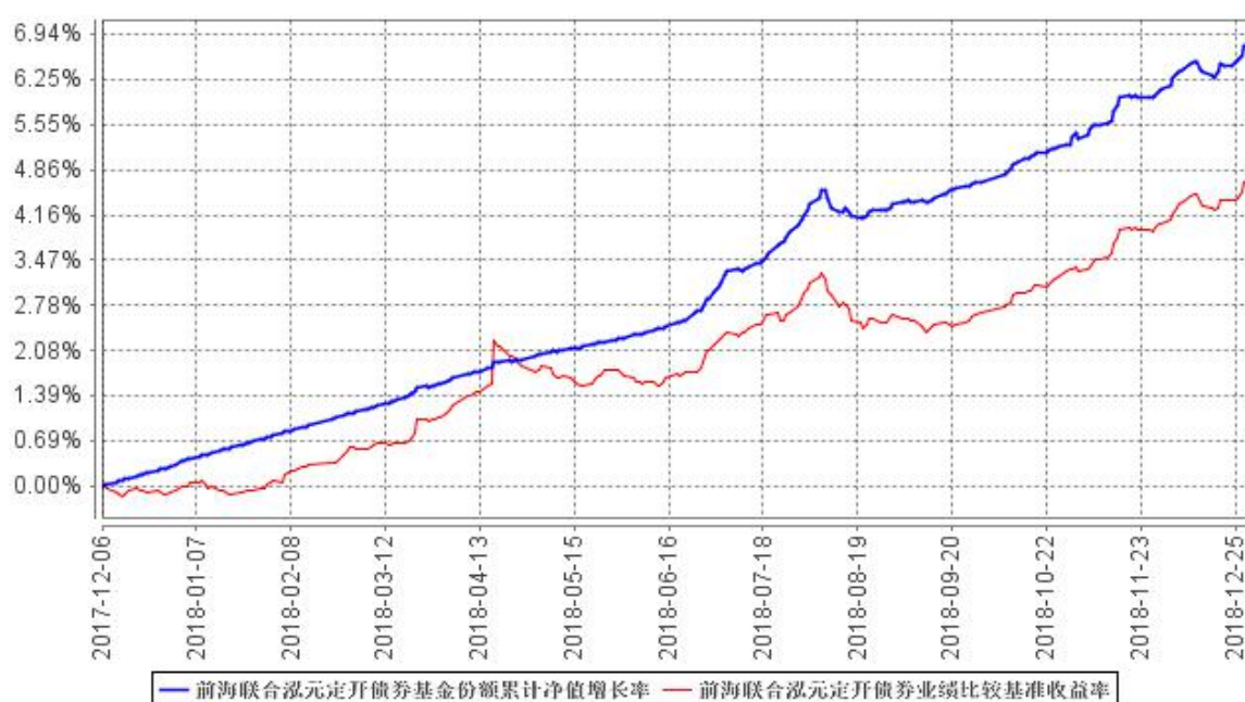
前海联合泓元定开债券基金份额累计净值增长率与同期业绩比较基准收益率的历史走势对比图

注：本基金的建仓期为 6 个月，建仓期结束时各项资产配置比例符合基金合同规定。截至报告期末，本基金建仓期结束未满 1 年。