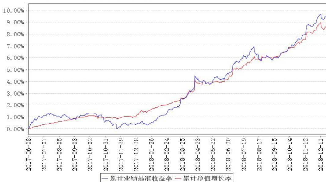
鹏华丰源债券累计净值增长率与同期业绩比较基准收益率的历史走势对比图