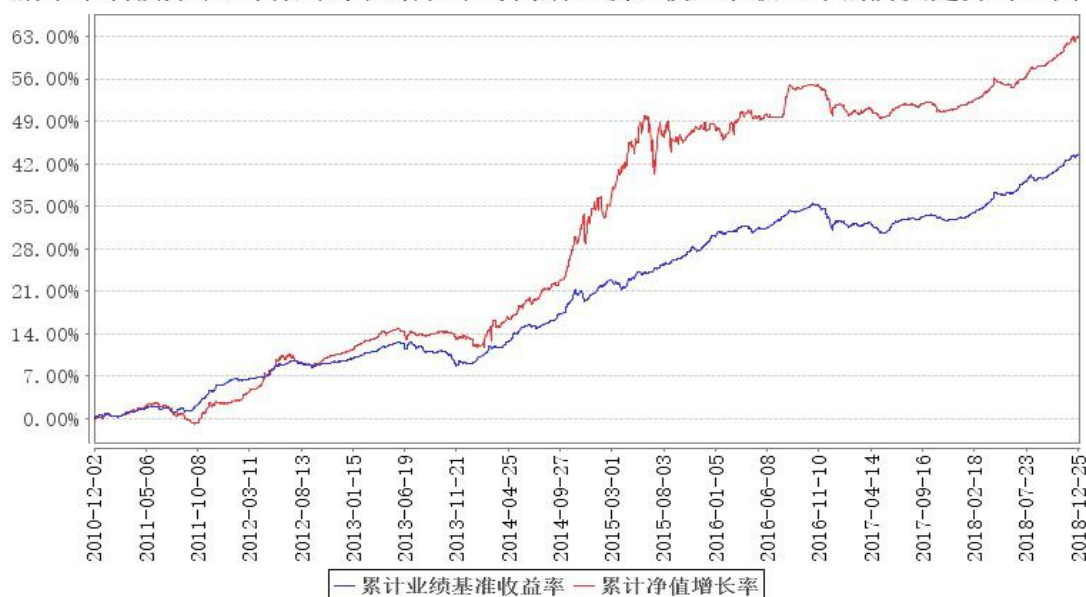
鹏华丰润债券 (LOF) 累计净值增长率与同期业绩比较基准收益率的历史走势对比图