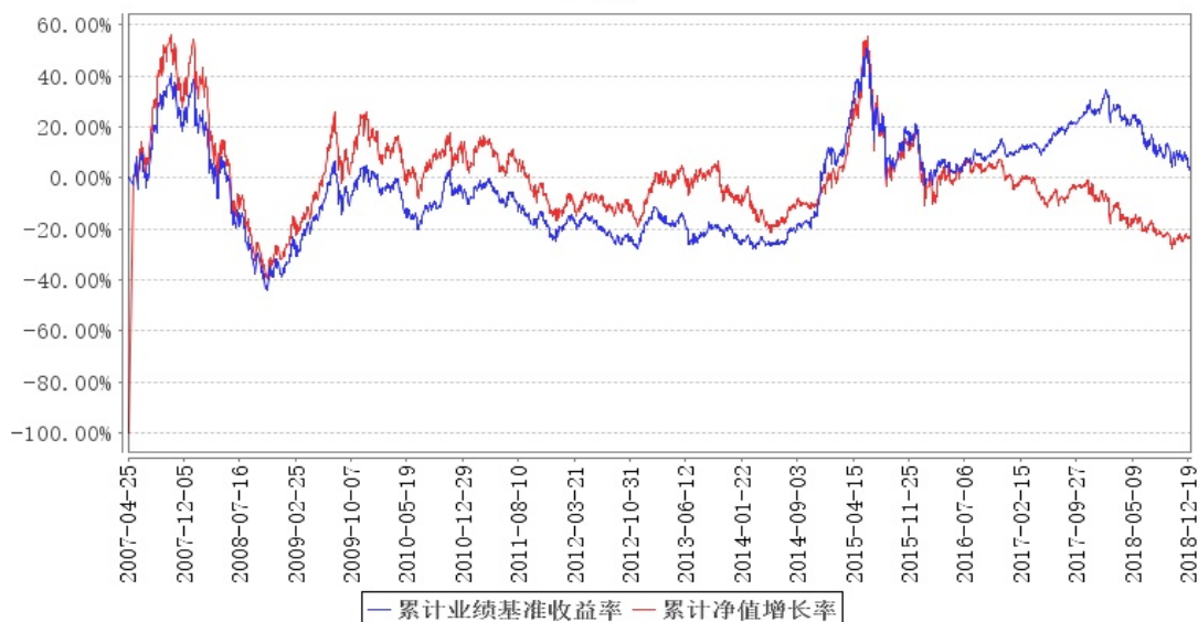
鹏华优质治理混合 (LOF) 累计净值增长率与同期业绩比较基准收益率的历史走势对比图