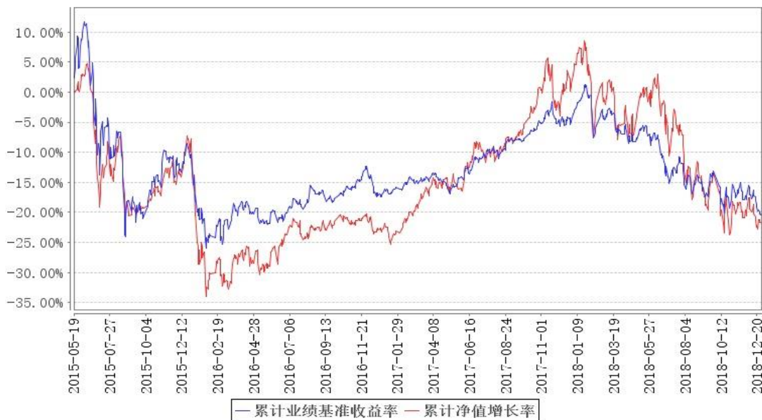
鹏华外延成长累计净值增长率与同期业绩比较基准收益率的历史走势对比图