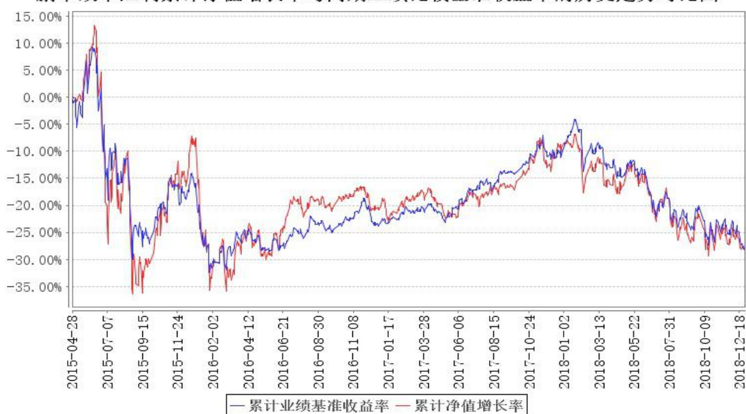
鹏华改革红利累计净值增长率与同期业绩比较基准收益率的历史走势对比图