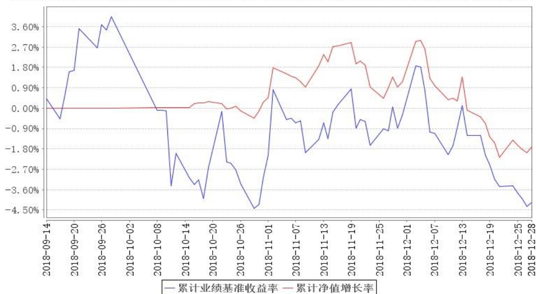
鹏华研究驱动混合累计净值增长率与同期业绩比较基准收益率的历史走势对比图

注：1、本基金基金合同于 2018 年 09 月 14 日生效，截至本报告期末本基金基金合同生效未满一 第 6 页 共 35 页