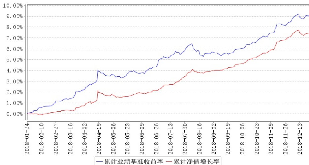
鹏华永泽定期开放债券累计净值增长率与同期业绩比较基准收益率的历史走势对比图

注：1、本基金基金合同于 2018 年 01 月 24 日生效，截至本报告期末本基金基金合同生效未满一年。2、截至建仓期结束，本基金的各项投资比例已达到基金合同中规定的各项比例