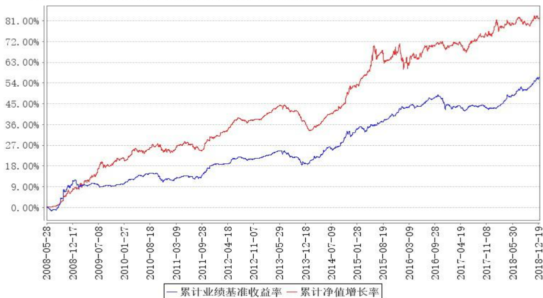
鹏华丰收债券累计净值增长率与同期业绩比较基准收益率的历史走势对比图