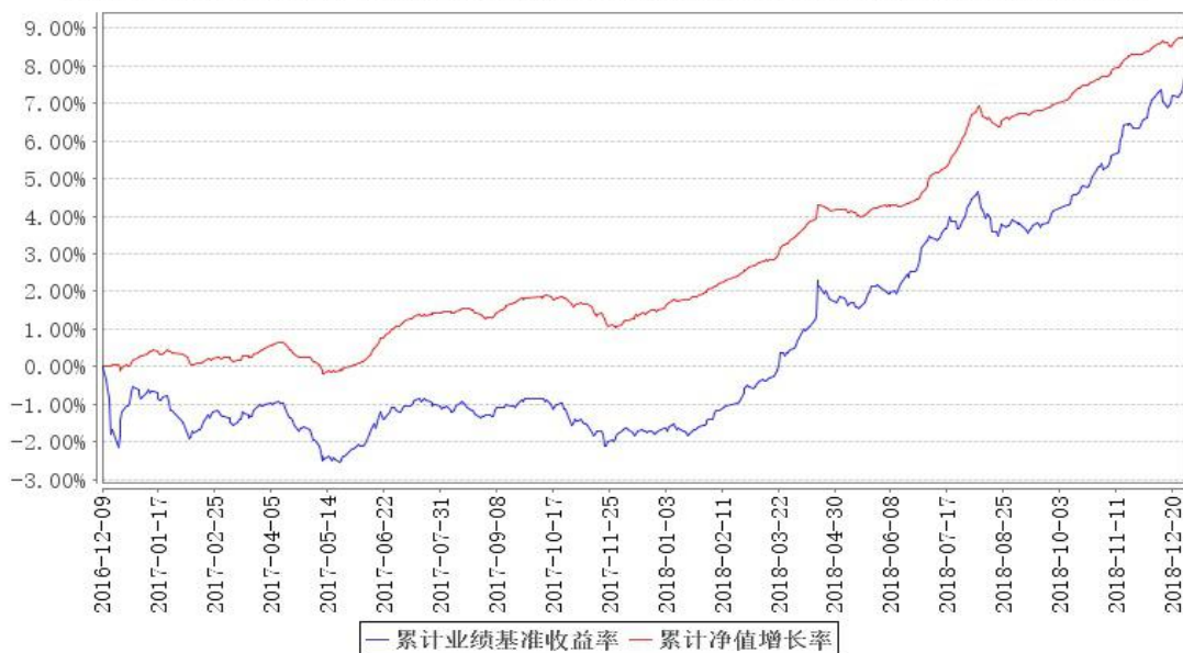
鹏华丰惠债券累计净值增长率与同期业绩比较基准收益率的历史走势对比图