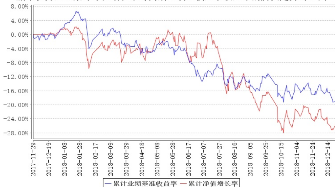
鹏华优势企业累计净值增长率与同期业绩比较基准收益率的历史走势对比图

注：1、本基金基金合同于 2017 年 11 月 29 日生效。2、截至建仓期结束，本基金的各项投资比例已达到基金合同中规定的各项比例。