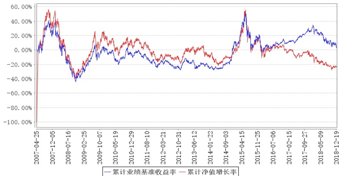
鹏华优质治理混合 (LOF) 累计净值增长率与同期业绩比较基准收益率的历史走势对比图