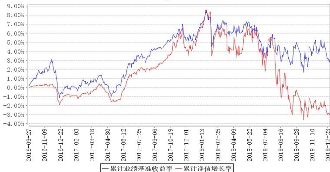
鹏华兴安定期开放混合累计净值增长率与同期业绩比较基准收益率的历史走势对比图