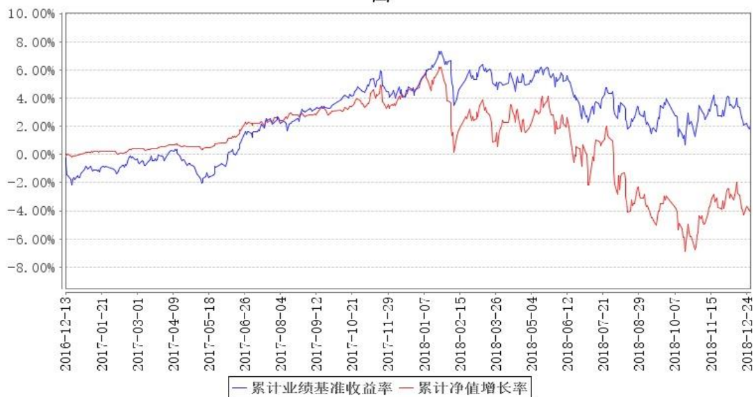
鹏华兴悦定期开放混合累计净值增长率与同期业绩比较基准收益率的历史走势对比图