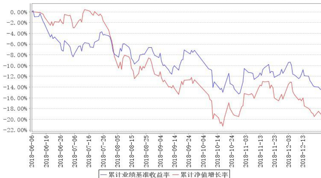
鹏华创新驱动混合累计净值增长率与同期业绩比较基准收益率的历史走势对比图

注：1、本基金基金合同于 2018 年 06 月 06 日生效，截至本报告期末本基金基金合同生效未满足一年。