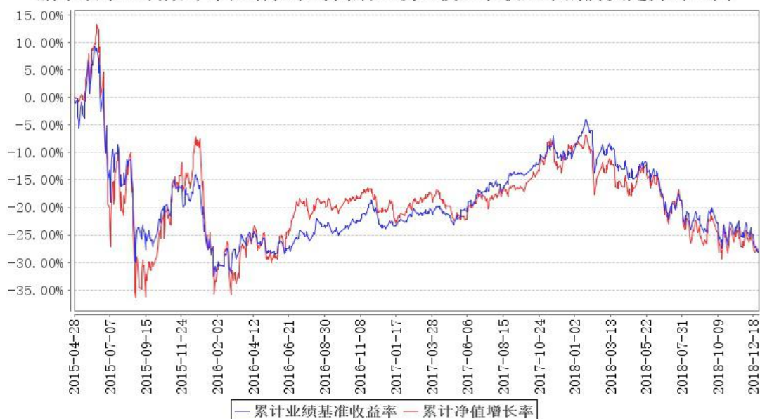
鹏华改革红利累计净值增长率与同期业绩比较基准收益率的历史走势对比图