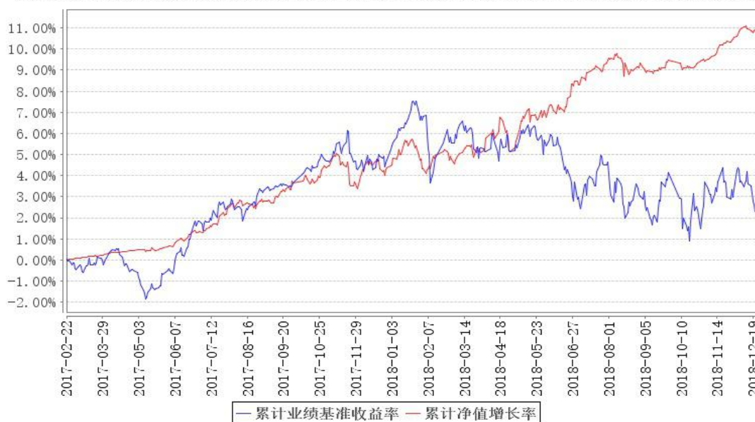
鹏华安益增强混合累计净值增长率与同期业绩比较基准收益率的历史走势对比图