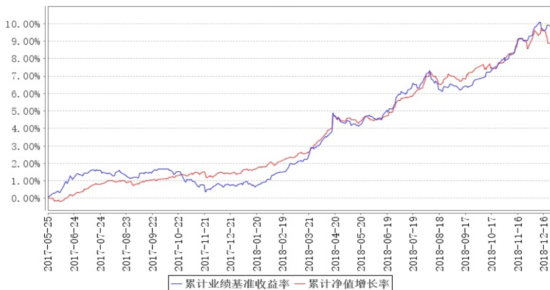
鹏华永泰定期开放债券累计净值增长率与同期业绩比较基准收益率的历史走势对比图