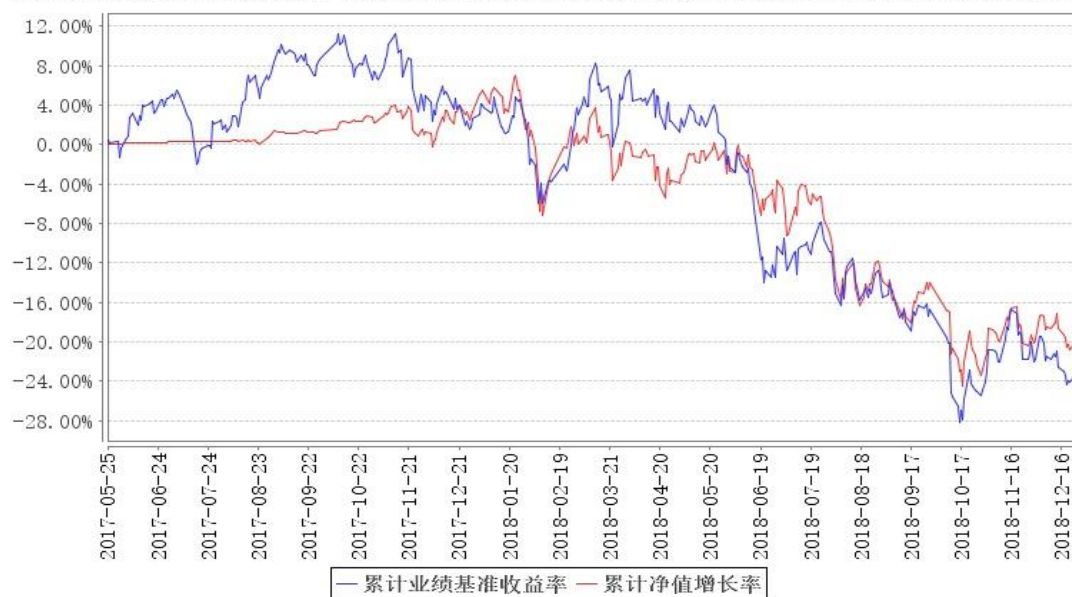
鹏华新科技传媒混合累计净值增长率与同期业绩比较基准收益率的历史走势对比图