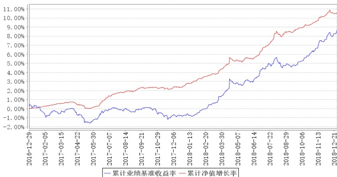
鹏华永盛定期开放债券累计净值增长率与同期业绩比较基准收益率的历史走势对比图