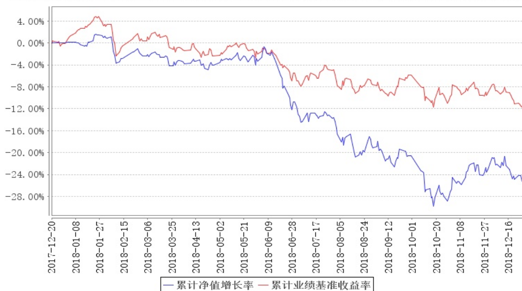
大成盛世精选混合累计净值增长率与同期业绩比较基准收益率的历史走势对比图

注:本基金合同规定,基金管理人应当自基金合同生效之日起六个月内使基金的投资组合比例符合基金合同的约定。建仓期结束时,本基金的投资组合比例符合基金合同的约定。