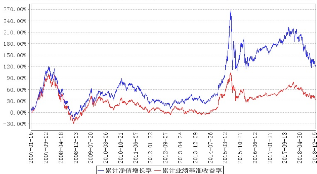
大成积极成长混合累计净值增长率与同期业绩比较基准收益率的历史走势对比图

注： 1、按基金合同规定，大成积极成长混合型证券投资基金自基金合同生效之日起 3 个月内为建仓期。截至建仓期结束时，本基金的投资组合比例符合基金合同的约定。