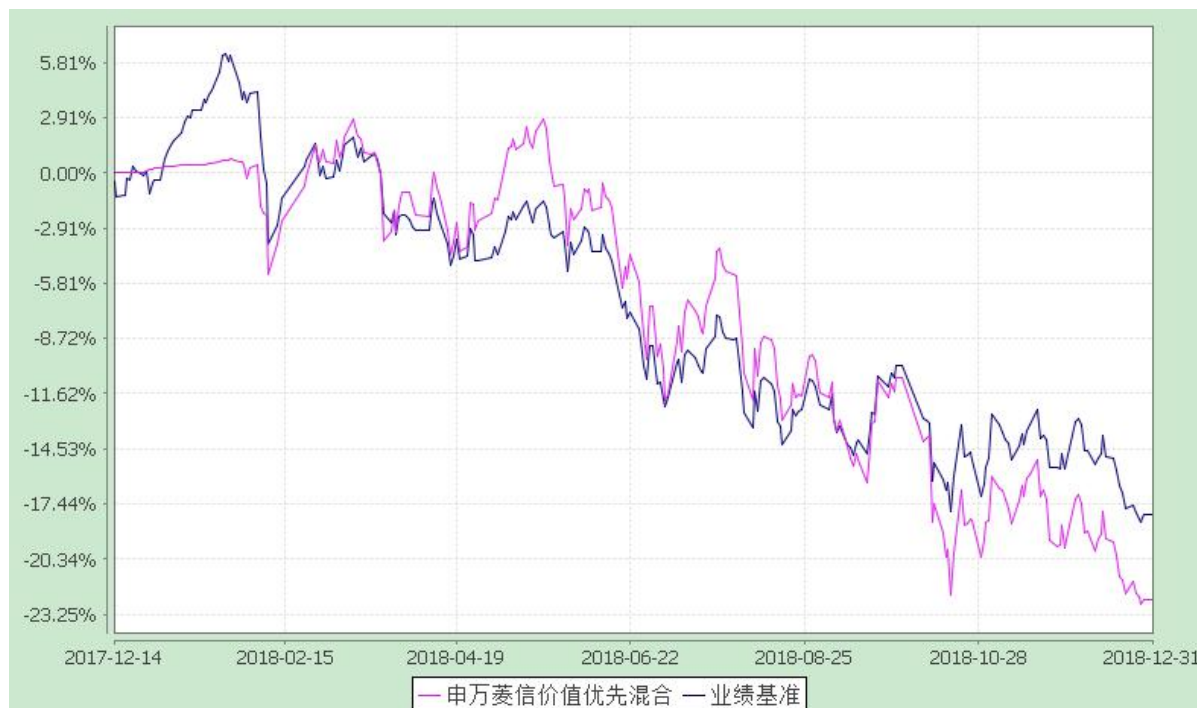
自基金合同生效以来份额累计净值增长率与业绩比较基准收益率的历史走势对比图 (2017 年 12 月 14 日至 2018 年 12 月 31 日)