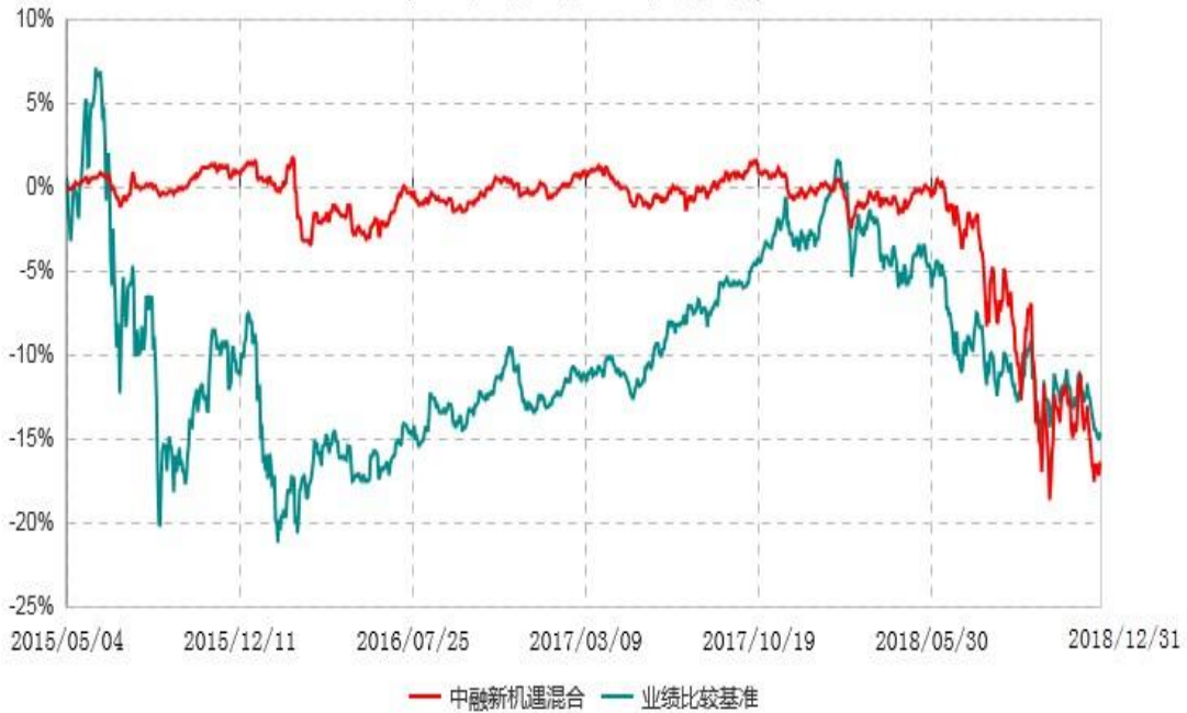
中融新机遇灵活配置混合型证券投资基金累计净值增长率与业绩比较基准收益率历史走势对比图 (2015年05月04日-2018年12月31日)

注：按照基金合同和招募说明书的约定，本基金自合同生效日起6个月内为建仓期，建仓期结束时本基金的各项资产配置比例符合基金合同的有关约定。