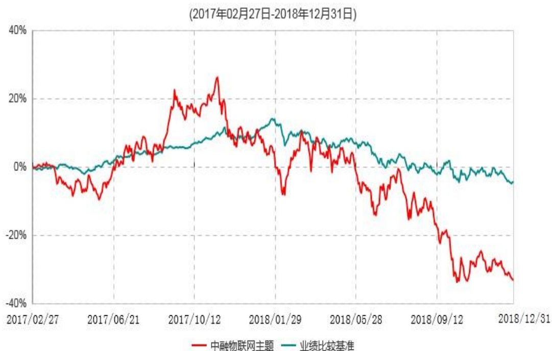
中融物联网主题灵活配置混合型证券投资基金累计净值增长率与业绩比较基准收益率历史走势对比图

注：按照基金合同和招募说明书的约定，本基金自合同生效日起6个月内为建仓期，建仓期结束时本基金的各项资产配置比例符合基金合同的有关约定。