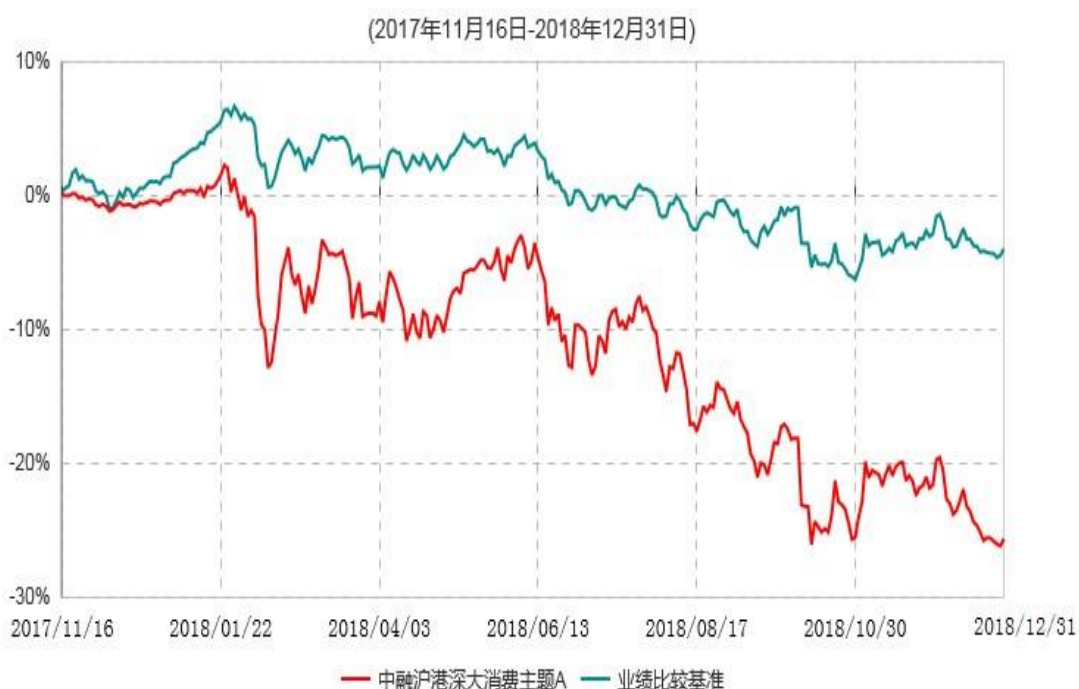
中融沪港深大消费主题A累计净值增长率与业绩比较基准收益率历史走势对比图