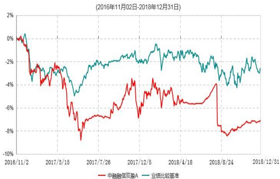
中融融信双盈A累计净值增长率与业绩比较基准收益率历史走势对比图