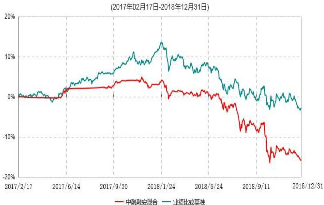
中融融安灵活配置混合型证券投资基金累计净值增长率与业绩比较基准收益率历史走势对比图

注：按照基金合同和招募说明书的约定，本基金自合同生效日起6个月内为建仓期，建仓期结束时本基金的各项资产配置比例符合基金合同的有关约定。