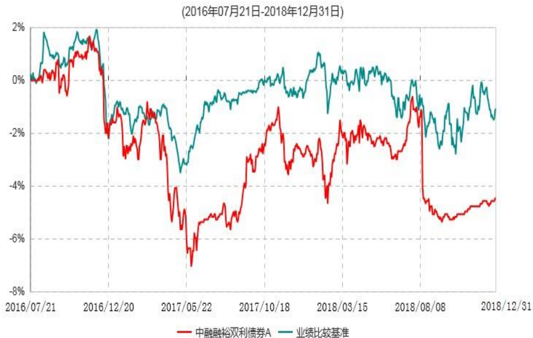
中融融裕双利债券A累计净值增长率与业绩比较基准收益率历史走势对比图