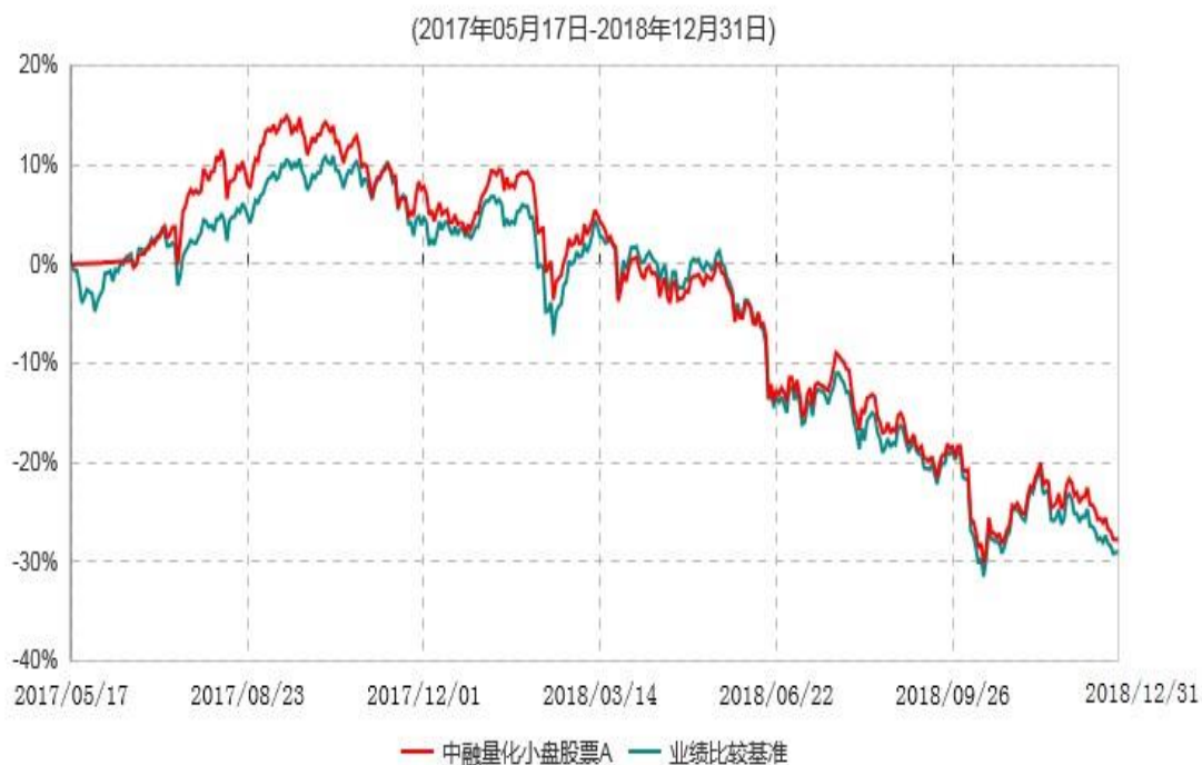
中融量化小盘股票A累计净值增长率与业绩比较基准收益率历史走势对比图