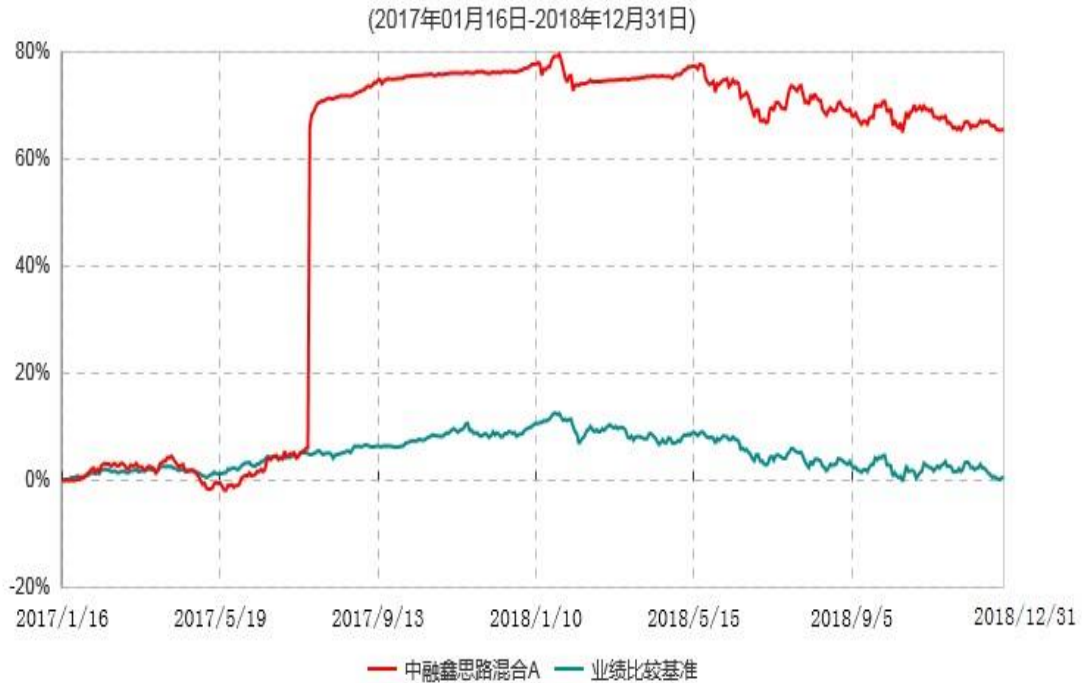
中融鑫思路混合C累计净值增长率与业绩比较基准收益率历史走势对比图