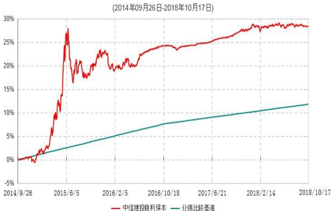
中信建投稳利保本混合型证券投资基金累计净值增长率与业绩比较基准收益率历史走势对比图

注：根据《中信建投稳利保本混合型证券投资基金基金合同》的有关规定，2018年10月12日为本基金的第一个保本周期到期日。