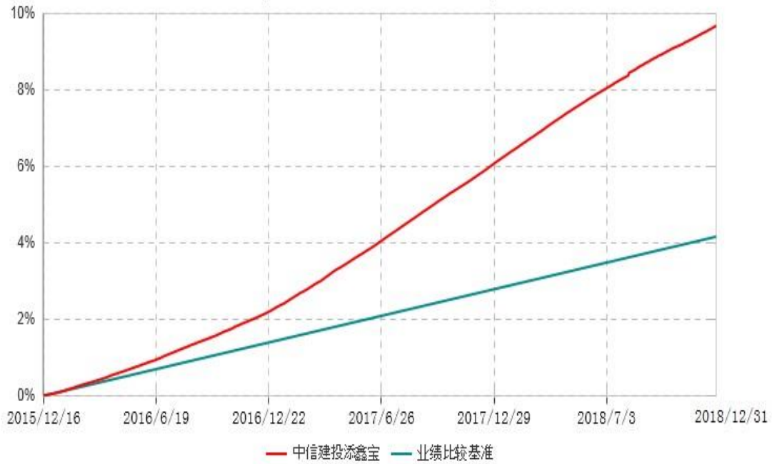
中信建投添鑫宝货币市场基金累计净值收益率与业绩比较基准收益率历史走势对比图 (2015年12月16日-2018年12月31日)