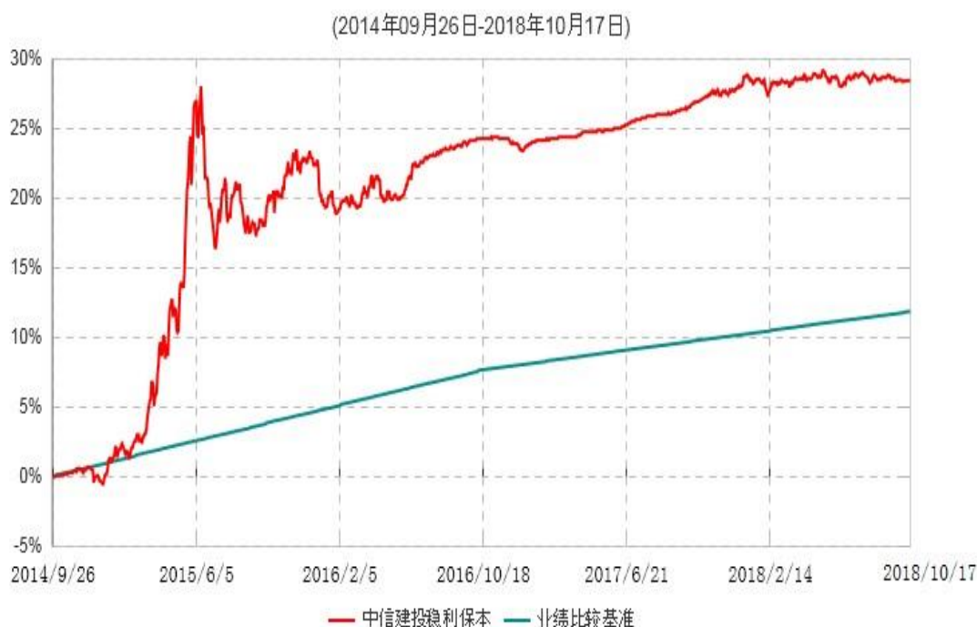
中信建投稳利保本混合型证券投资基金累计净值增长率与业绩比较基准收益率历史走势对比图

注：根据《中信建投稳利保本混合型证券投资基金基金合同》的有关规定，2018年10月12日为本基金的第一个保本周期到期日。