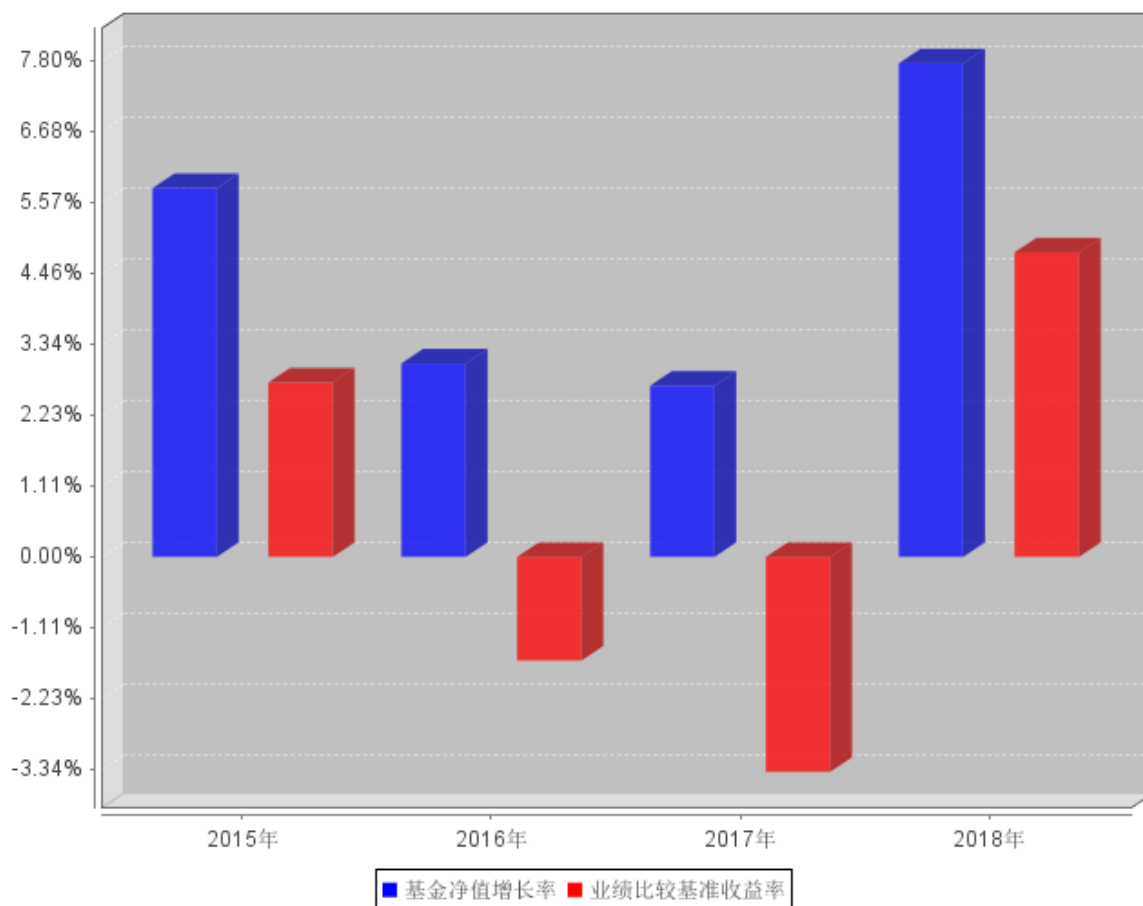
自基金合同生效以来基金每年净值增长率及其与同期业绩比较基准收益率的对比图