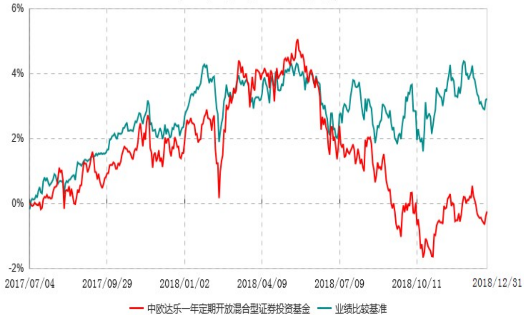
中欧达乐一年定期开放混合型证券投资基金累计净值增长率与业绩比较基准收益率历史走势对比图 (2017年07月04日-2018年12月31日)

注：本基金基金合同生效日期为2017年7月4日，按基金合同的规定，本基金自基金合同生效起六个月为建仓期，建仓期结束时各项资产配置比例已达到基金合同约定。