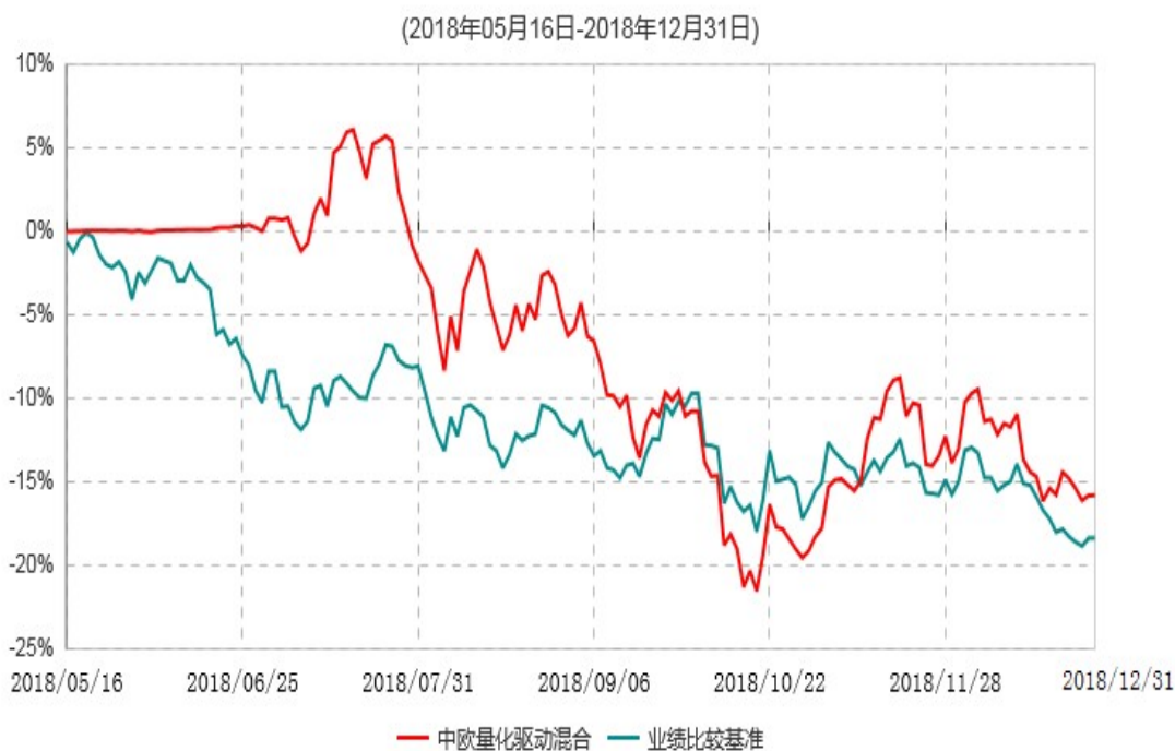
中欧量化驱动混合型证券投资基金累计净值增长率与业绩比较基准收益率历史走势对比图

注：本基金基金合同生效日期为2018年5月16日，自基金合同生效日起到本报告期末不满一年，按基金合同的规定，本基金自基金合同生效起六个月为建仓期，建仓期结束时各项资产配置比例已符合基金合同约定。