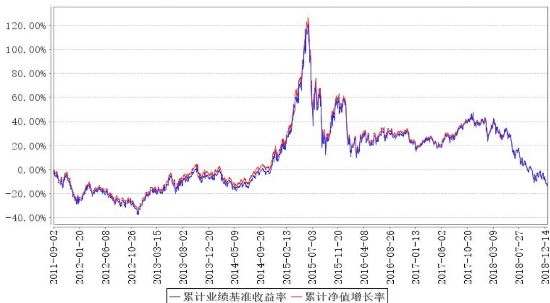
民营ETF累计净值增长率与同期业绩比较基准收益率的历史走势对比图