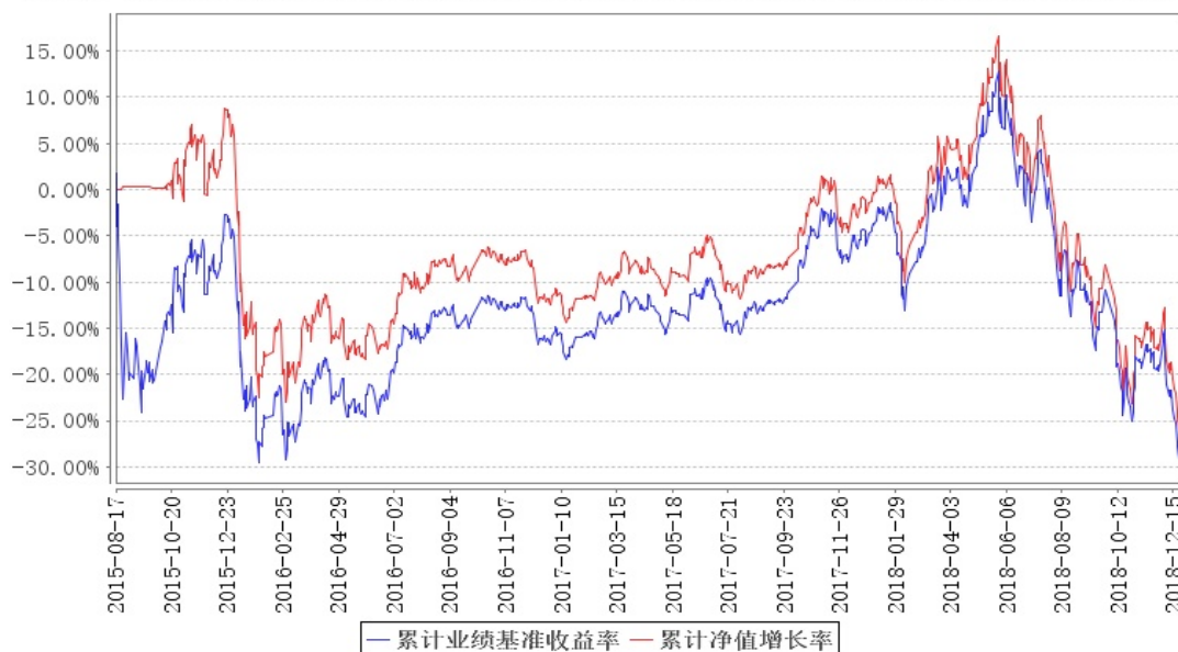
鹏华中证医药卫生累计净值增长率与同期业绩比较基准收益率的历史走势对比图