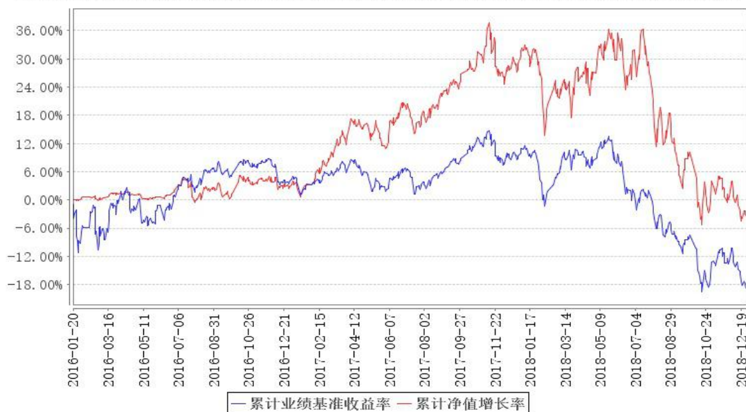
鹏华健康环保混合累计净值增长率与同期业绩比较基准收益率的历史走势对比图