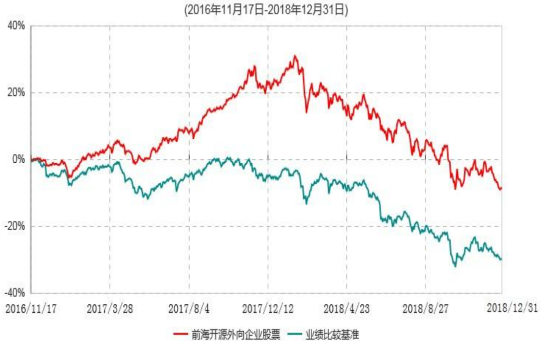
前海开源外向企业股票型证券投资基金累计净值增长率与业绩比较基准收益率历史走势对比图