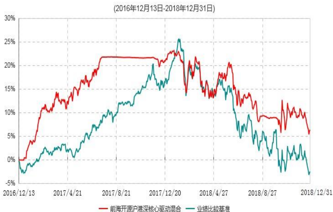
前海开源沪港深核心驱动灵活配置混合型证券投资基金累计净值增长率与业绩比较基准收益率历史走势对比图