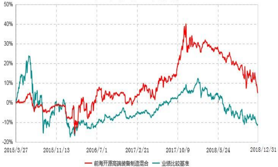
前海开源高端装备制造灵活配置混合型证券投资基金累计净值增长率与业绩比较基准收益率历史走势对比图 (2015年03月27日-2018年12月31日)