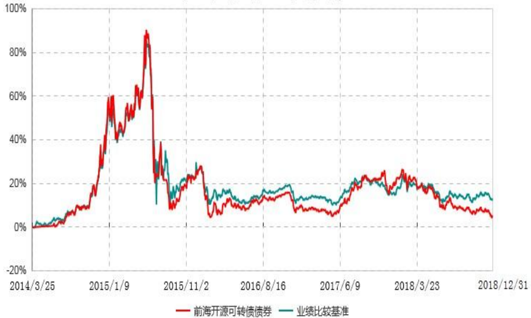
前海开源可转债债券型发起式证券投资基金累计净值增长率与业绩比较基准收益率历史走势对比图 (2014年03月25日-2018年12月31日)