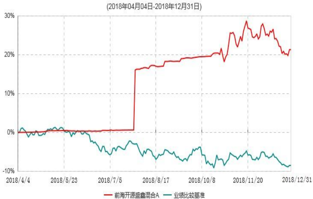
前海开源盛鑫混合A累计净值增长率与业绩比较基准收益率历史走势对比图