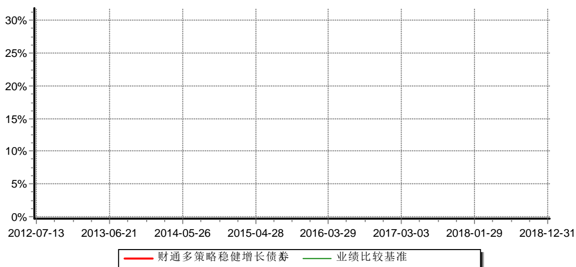
财通多策略稳健增长债券型证券投资基金A 累计净值增长率与业绩比较基准收益率历史走势对比图 (2012年7月13日-2018年12月31日)